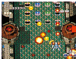
▲精霊球は、宝箱や気球などのアイテムキャラクターを撃つと出現するぞ。

地・火・風・水それぞれに色分けされた4種類の精霊球がパワーアップ・アイテムです。自機は精霊球を3つまで持つことができ、その精霊球の組み合わせによって、29種類のさまざまな攻撃形態をとることができます。