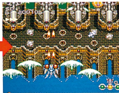
▲精霊球の組み合わせによって、自機の攻撃がさまざまなパワーアップ。